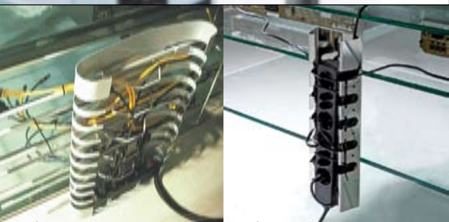
Guide câbles Spyder Cable Spyder