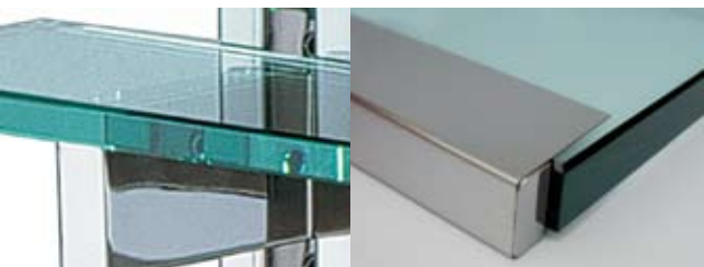
Etagères à hauteur réglable Height adjustability